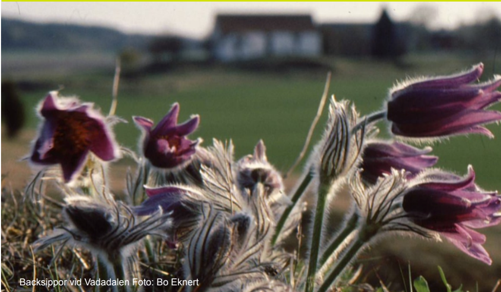
Backsippor vid Vadadalen